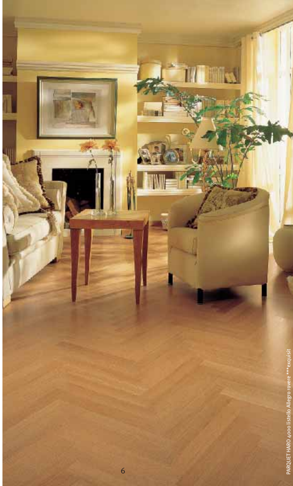
PARQUET HARO 4.000 listello Allegra rovere ***exquisit