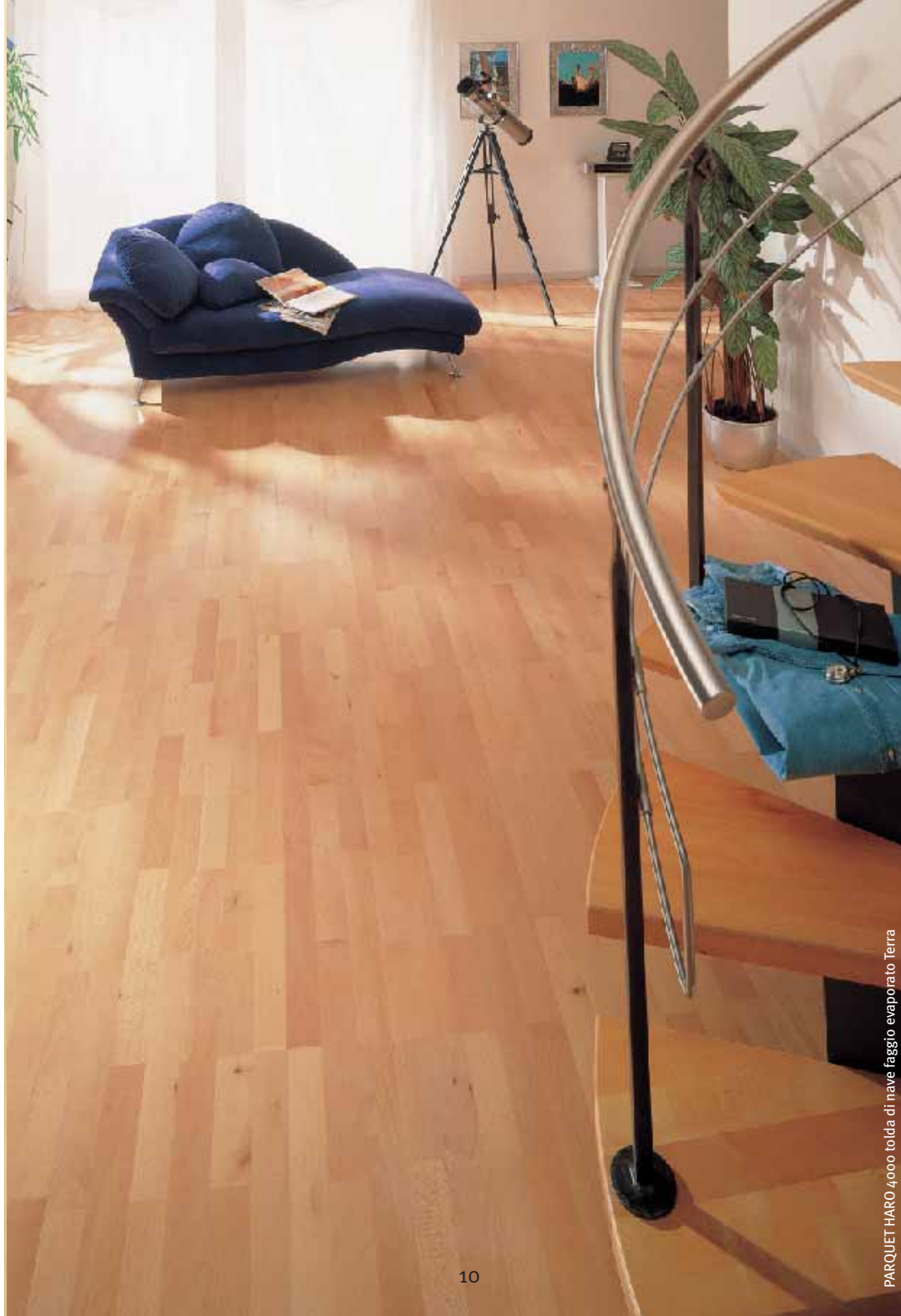
PARQUET HARO 4000 tolda di nave faggio evaporato Terra